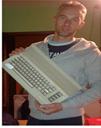
Commodore 64 e la programmazione in linguaggio macchina (il costrutto read-poke-data per la gestione di controlli, suono, grafica, sprite, file koala...)